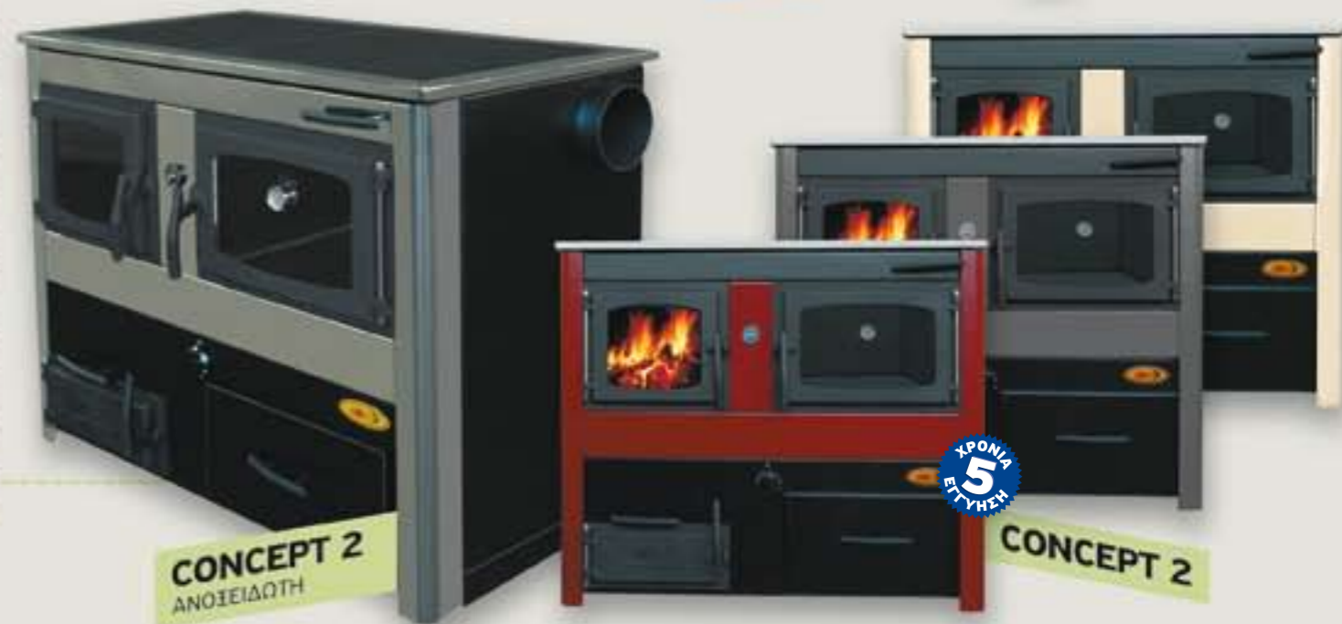
CONCEPT 2 ΑΝΟΞΕΙΔΩΤΗ