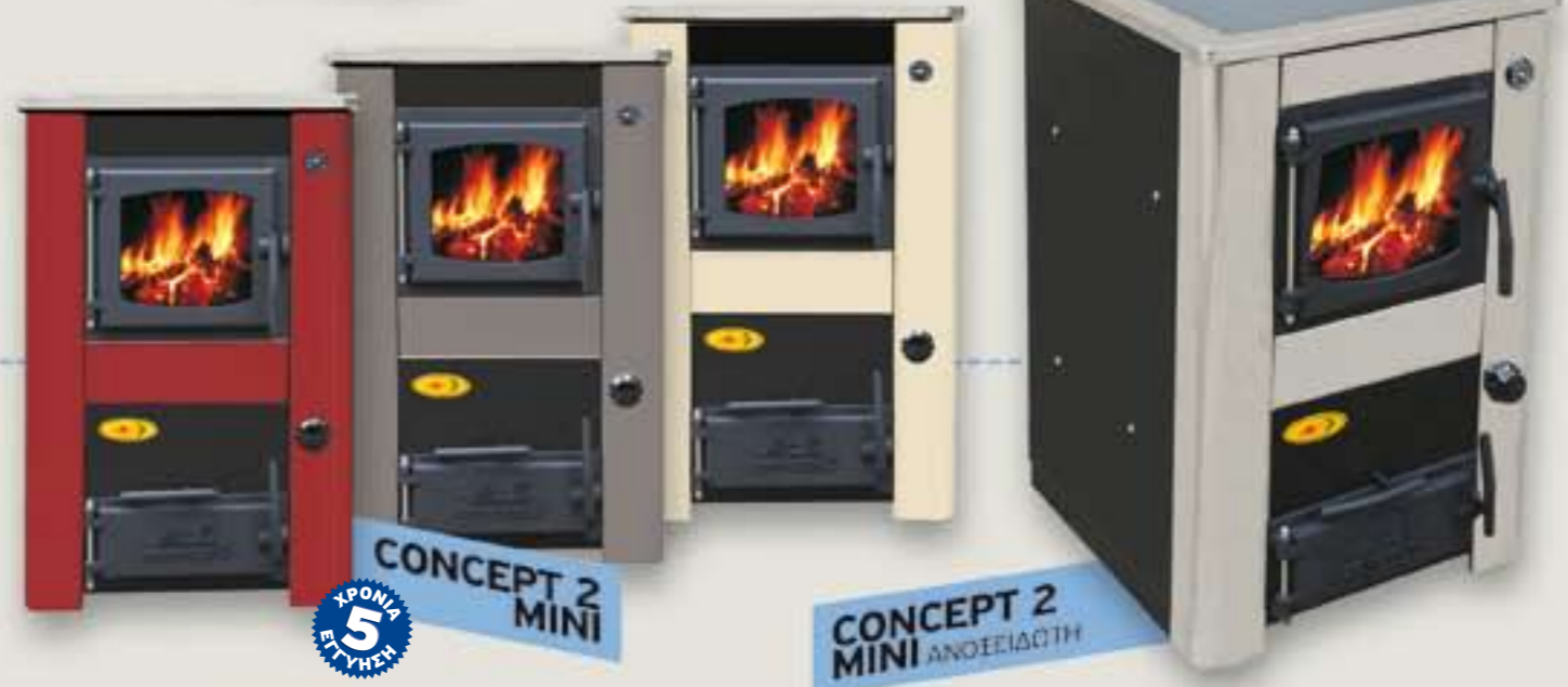
CONCEPT 2 MINI